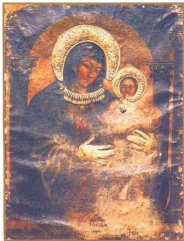
أيقونة السيدة مريم العذراء والدة الإله، رسمها لوقا الإنجيلي، عالية الأسرار - دير مار مرقس / القدس معاً وبحبنا لهذا منبر من ديمونة ختمت أمي حتمياً. حبنا أروع / بنا أروع. آمين The Icon of Virgin Mary, Mother of God, painted by St. Luke the Evangelist, Upper Room, St. Mark's Convent/Jerusalem

Os ícones antigos, muitas vezes já corroídos pelo tempo ou que atravessaram guerras, são depositados no relicário da igreja com respeito, pois é um objeto que foi santificado pela oração.